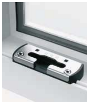
Jeden bezpečnostní protiplech použitelný pro pravá i levá okna.