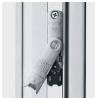
Prvek s trojitou funkcí: s pojistkou chybné manipulace, s přizvedáváním křídla a s balkónovou pojistkou.