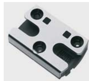
Různé úrovně zabezpečení na jediné platformě.