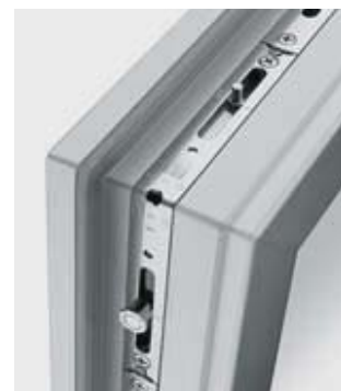
Na jednom otevíravě-sklopném křídle lze použít 3 shodná rohová vedení.