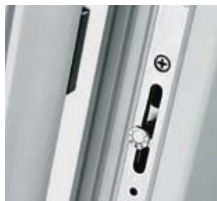
Osmihranný hříbek u všech montážních dílů a pro všechny bezpečnostní úrovně.