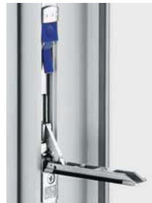
Uzavírací mechanismus v pasivním křídle štulového okna je díky výraznému tlačítku pro jeho odblokování zárukou vysoké míry komfortu.