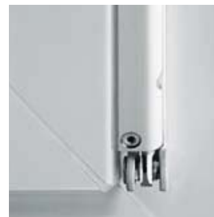
Křídlové ložisko s možností regulace přítlaku.